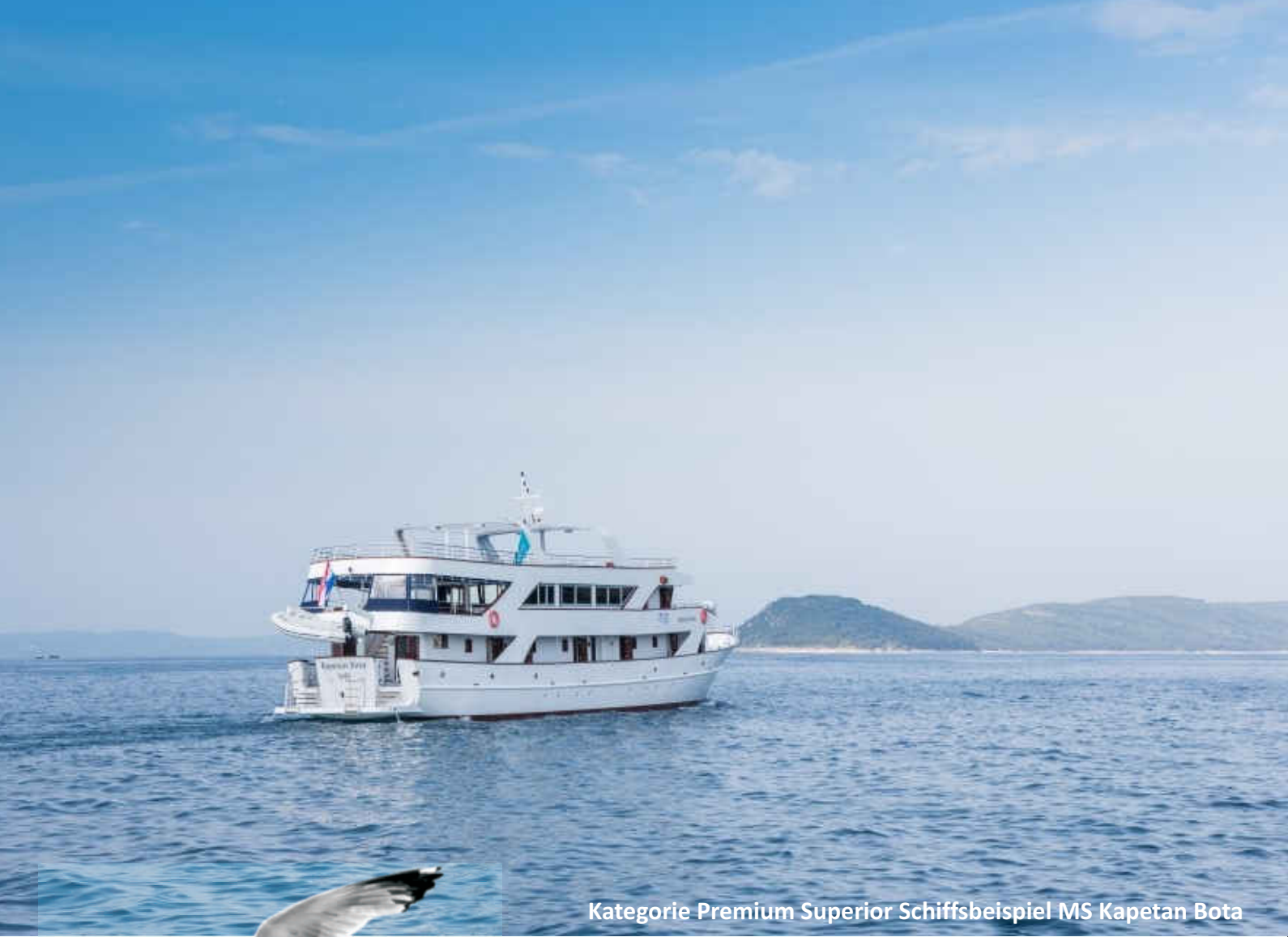
Kategorie Premium Superior Schiffsbeispiel MS Kapetan Bota