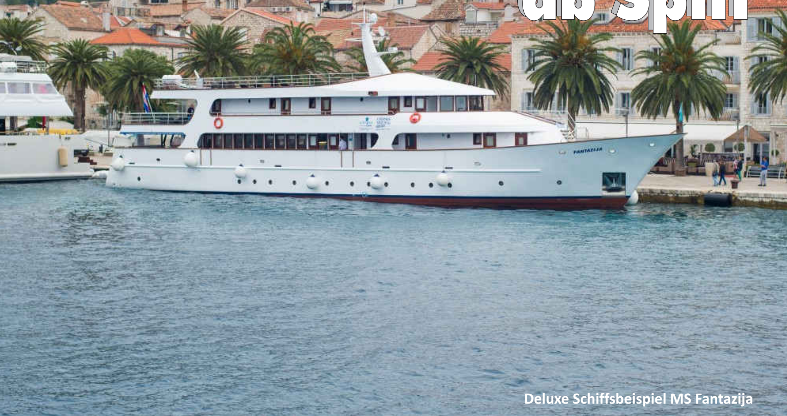
Deluxe Schiffsbeispiel MS Fantazija