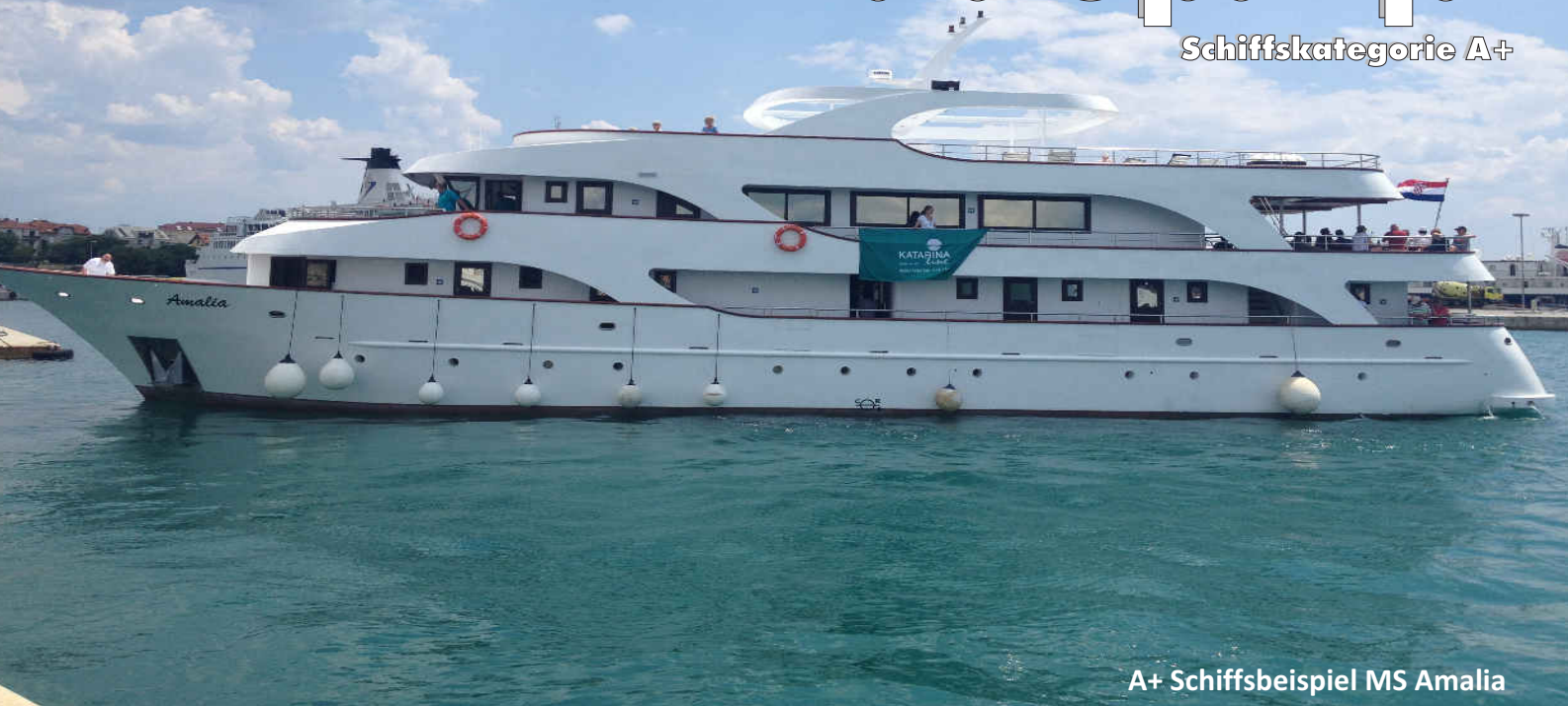
A+ Schiffsbeispiel MS Amalia